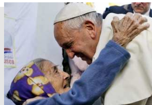
Papa Francesco Angelus, 3 de julho de 2016

Oremos ao Senhor, por intercessão da Virgem Maria, para que nunca faltem na Igreja corações generosos que trabalhem para levar a todos o amor e a ternura do Pai celeste”.